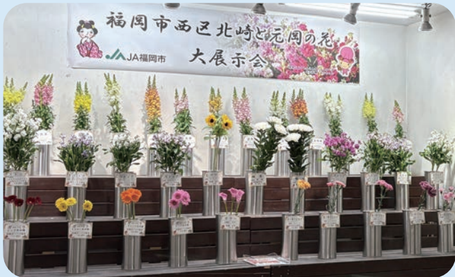
福岡市で生産された色とりどりの花きをご紹介しました

また、福岡花市場展示ブースではバラや金魚草、ストックなどJA福岡市管内で生産された花きの大展示会も開催され、買参人の皆さまに地元・福岡市産の花きが紹介されました。