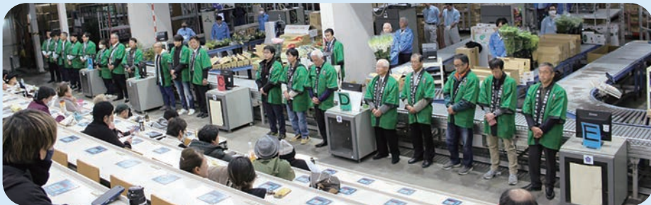
セリ場でのご挨拶の様子