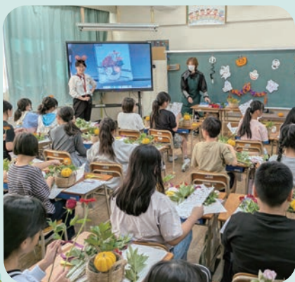
那珂南小学校にて

今後は10月から2月にかけて福岡市内の10の小中学校で花育体験教室を実施していきます。子どもたちには、福岡市で生産されたお花を使い、ハロウィンなどの季節のイベントを取り入れたフラワーアレンジメント作りを楽しんでもらう予定です。