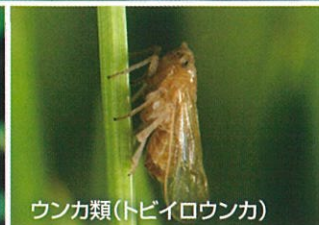
ウンカ類(トビイロウンカ)