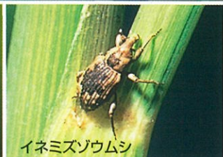
イネミスゾウムシ